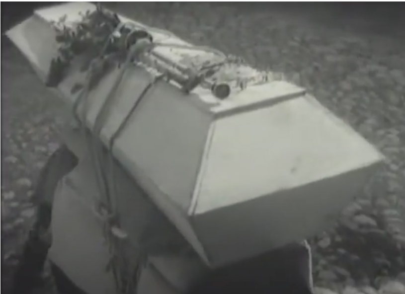
Fotograma de la tumba del argelino en Sierra de Teruel de André Malraux (1938)