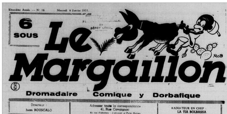
Rotatiu de Le Margailon

De nos atres y del « Margaillo » Sem bons tchicots, de via onesta. Que fadja, eï, juergues y resta : En una volta ya pagara El mal que fa a tot Oran. Margaillons ! estem be decidits A viure en paz y bons amios, Pa tirar a pique el cura En el carro la basura, Sera la unica manera Denviar, eï y la Carganera A San-Flour, fer mil puñetes. Salut ! Pesetes Y... forsa en es castañetes. EL GAT DEL BILAGE CARTO.