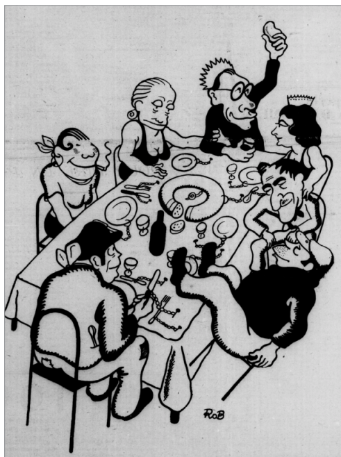
Caricatura de portada del número on apareix la columna