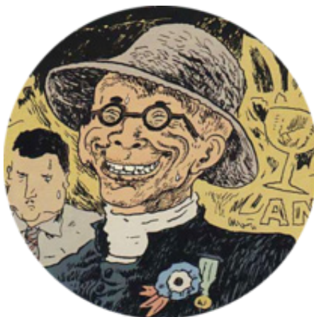
Personatge de Lambert al còmic Le Chat du Rabbín